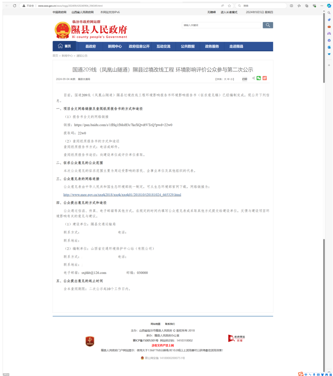
图 2 征求意见稿公示（网站二次公示）