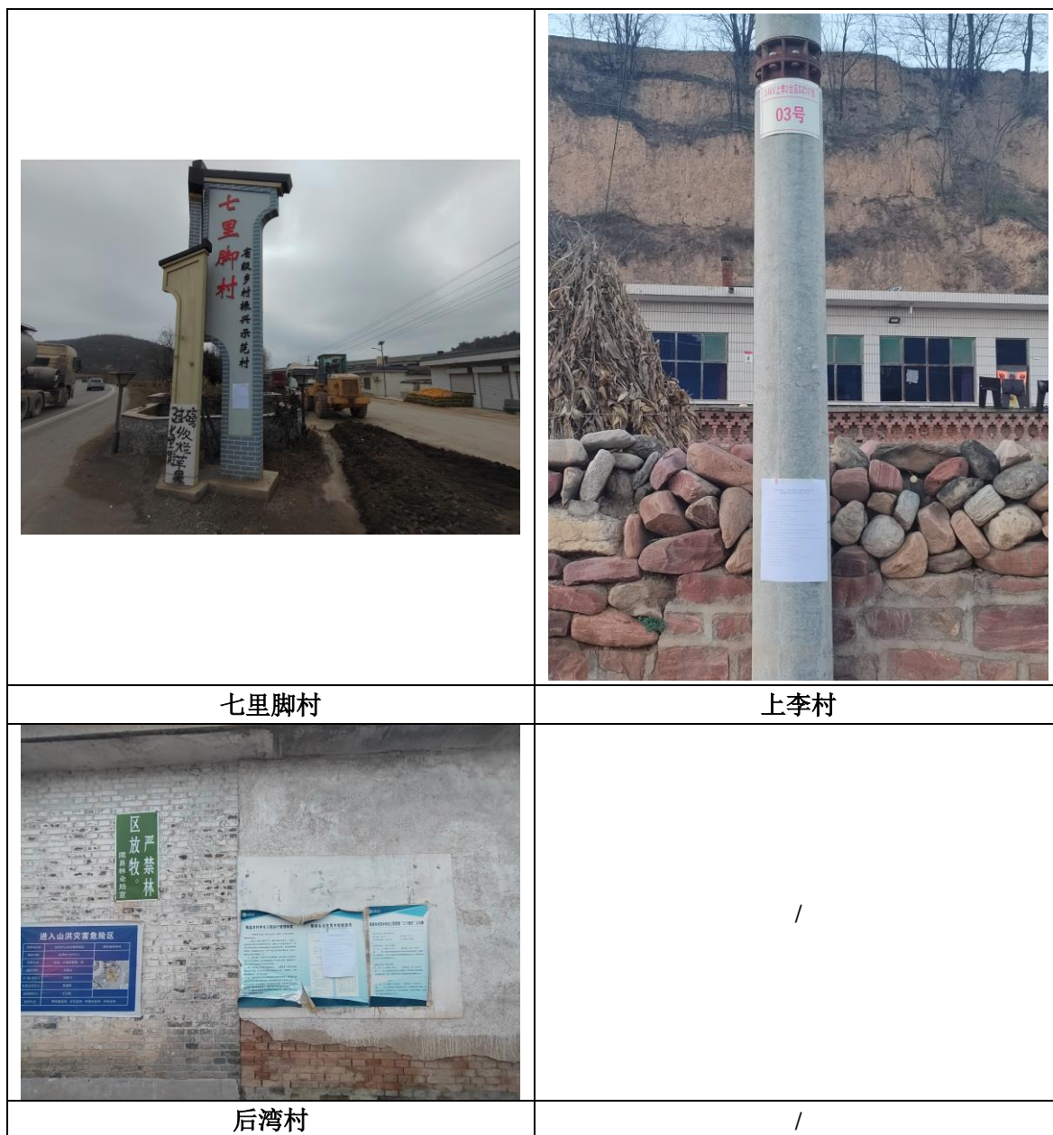
图 4 征求意见稿公示（张贴公示）