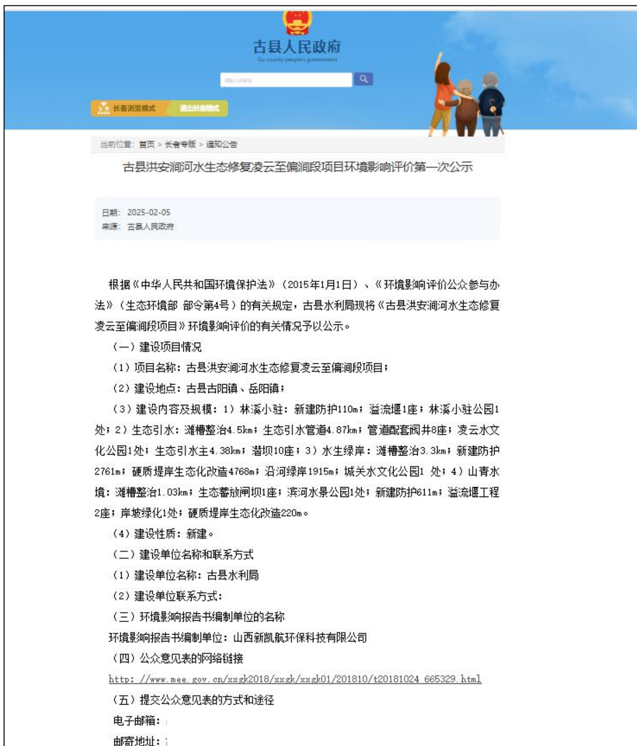
图 1: 第一次网络公示