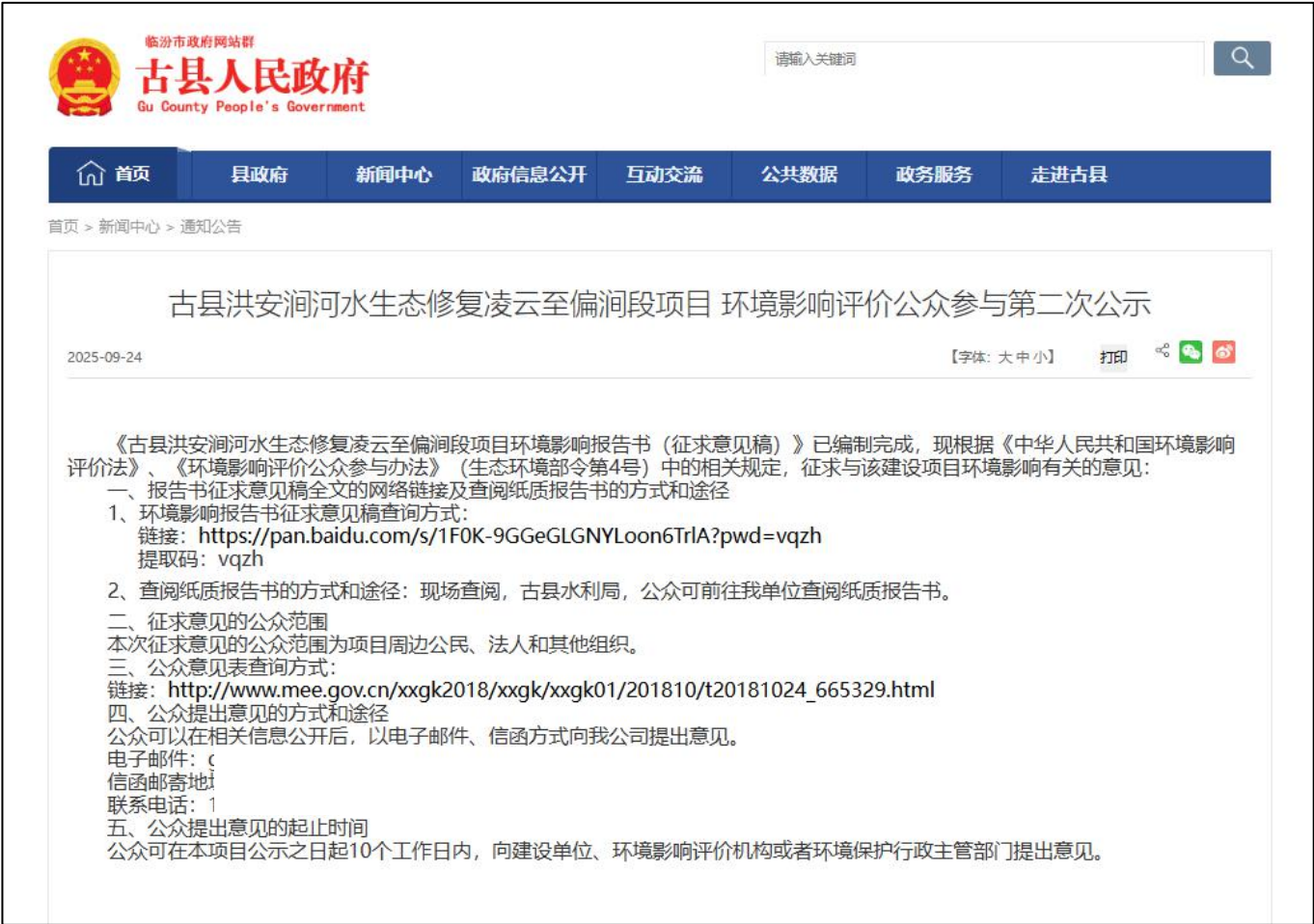
图 2：征求意见稿网络公示截图

建设单位 2025 年 9 月 24 日在古县人民政府网对征求意见稿进行了公示。公示截图见图 2。