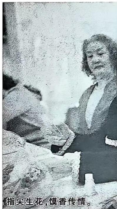
指尖生花, 馥香传情。