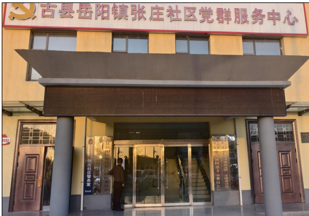
图 5：张贴公示情况图