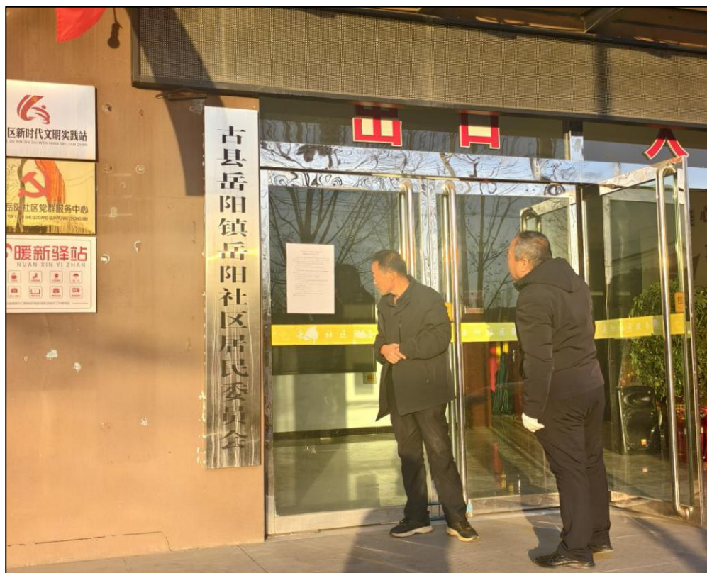
图 3：张贴公示情况图

在征求意见稿公示的 10 个工作日内，公示内容与网上公示内容一致。建设单位同步在项目所在地张贴公告，公示拟建项目相关信息。公示情况见图 3-图 5。