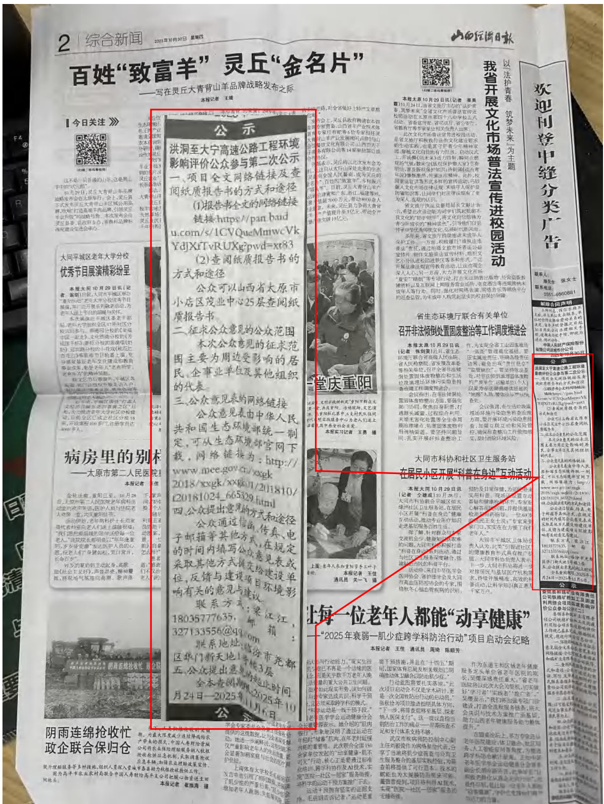
山西经济日报 2025年10月30日报纸